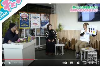
10の視え方を考えよう!暮らしの保健室だよ