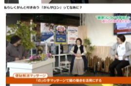
「暮らしについて考える」暮らしの保健室だよ